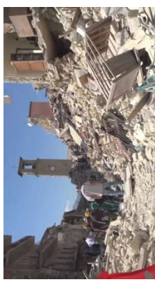
zemětřesení - 2016; magnitudo 5,9; 278 mrtvých

5. Popište problematiku vysídlování italského venkova.