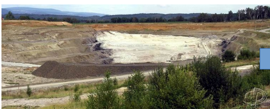
kaolinový lom Osmosa u Božičan