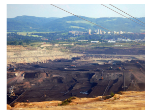
hnědouhelný lom Jiří Vřídlo (73 °C)