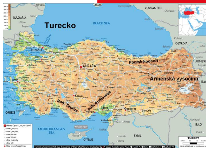
pojmy: Thrákie, Anatólie – Malá Asie, Bospor, Dardanely, Marmarské moře, pohoří Taurus, Ararat, Ankara, Istanbul, Severní Kypr,