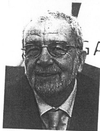
MUDr. František Koukolík, DrSc., současný český neuropatolog, zdraevň popularizátor vědy a esejista