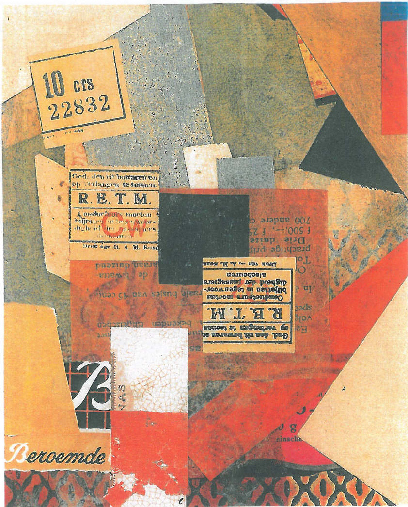
Merz 163 s potící se ženou, 1920, KURT SCHWITTERS „Merz“ je název, jež dal Schwitters své vlastní metodě shromažďování přebytečných předmětů z každodenního života, jako například použitých tramvajových lístků, známek a obalů. Chtěl vyvinout metodu umělecké tvorby, která by nebyla vázána konvencemi a normami, jež jí vnutila společnost a tradice výtvarného umění.